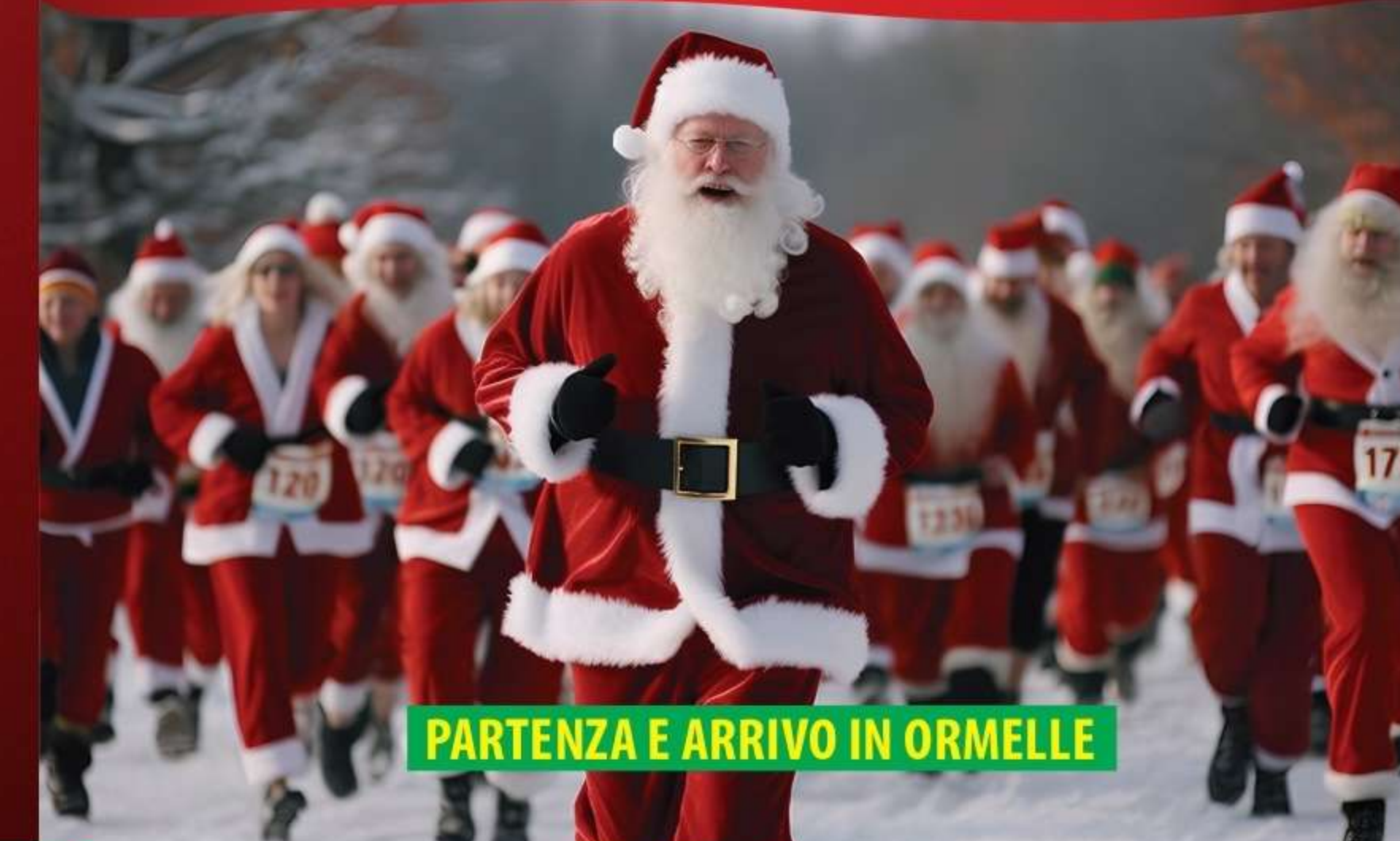
PARTENZA E ARRIVO IN ORMELLE